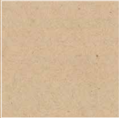
Lookback Lappato 89,46x89,46 cm G-6394