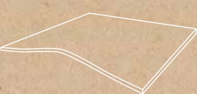
Lookback BAG** 44,63x89,46 cm / 89,46 x 89,46 cm G-5599 / G-5795