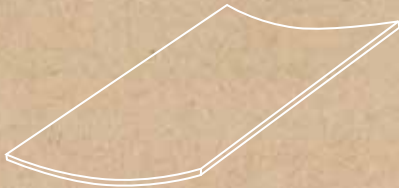
Lookback CAVE** 44,63 x 89,46 cm G-5599