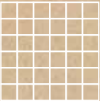
Lookback Lappato Mos. 5x5* 29,75x29,75 cm G-6644