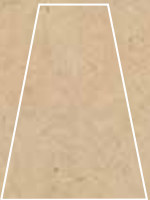
Lookback Lap. Trapeze 35x44,63 cm G-5211

* Available in all colours of Lookback collection. * Disponible en todos los colores de la colección Lookback.