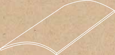
Lookback VEXA** 44,63 x 89,46 cm G-5599