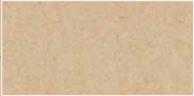
Lookback Lappato 44,63x89,46 cm G-6274